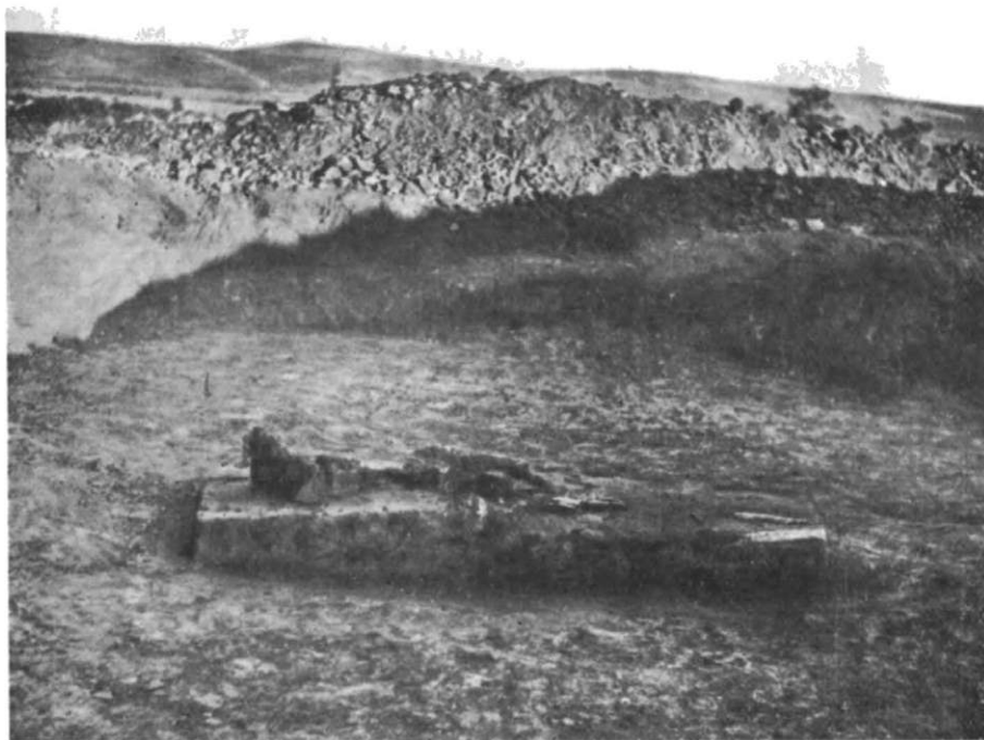
Fig. 2. — Alba Iulia. Mormint de inhumație (M 50).

Și acum, ca și în timpul cercetărilor din anii 1956—1957, s-a observat gruparea mormintelor de incinerare într-o anumită parte a cimitirului, distinctă de zona mormintelor cu sarcofag de cărămidă. Acest fapt nu are o semnificație cronologică, deoarece mormintele de incinerare, pe baza monedelor și a altor obiecte de inventar, s-au dovedit a fi contemporane cu cele de înhumare. Este